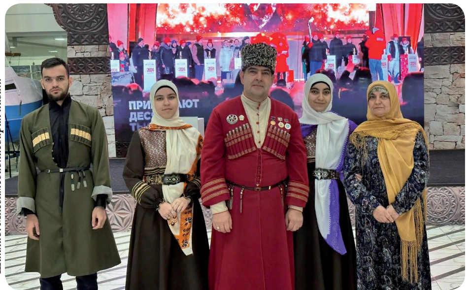
Шиклий: Мягъямедялиеварин хизан.

Февралин 1-пи йигъан Мягъячгъалайиъ Урус театрийи Дагъустандйи хизандин Йис ачмиш ап'бан серенжем к'ули гъубшну.