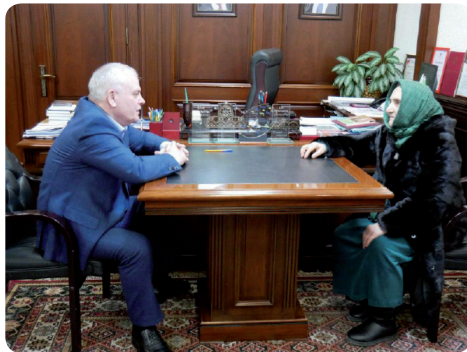
Мягъямедоварин хизан гъадму саб вахтна Дагъустандин Огни шагъриз

А в, дугъриданра, Аблибег Сеферовди кьайд гъаплганси,